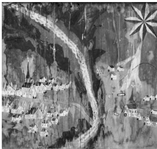
Il barschament da Camischolas