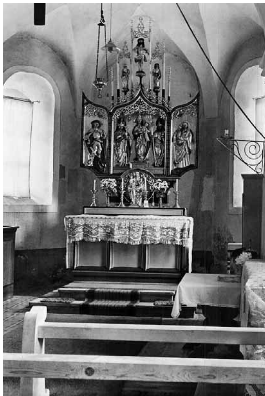
Igl altar gotic a S. Onna