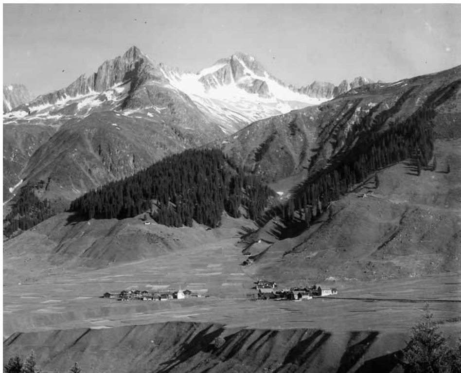
Zarcuns e Camischolas