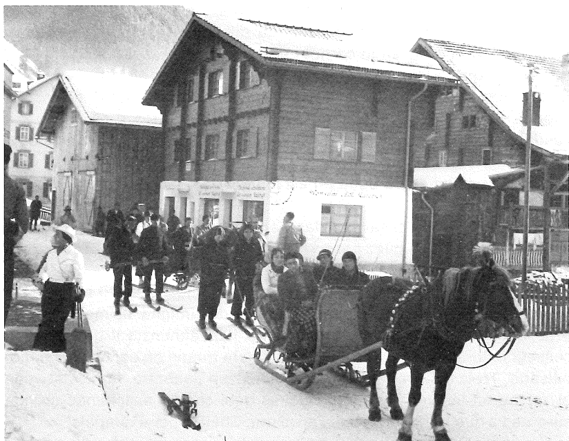
L'emprema casa dil Consum liber a Sedrun construida 1933

Dapi 1933 ha la societad silmeins ina atgna casa da fatschenta. Damai ch'ins ha stuiu serestrenscher cun il sulom, ha ei giu num far quen cun mintga cantun dil baghetg. Igl empren ei vegniu mussau a mi las localitads e nua che tut las raubas eran deponidas e cavegliadas. Haiel stuiu constatar ch'il plaz era scarts, mo ei basegna saver seolver e sedrizzar leusuenter. Per frinas, uaffens dil funs etc., fuva in magasin en in local privat ual dasperas a disposiziun.