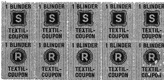
Marcas da raziun dalla davosa uiara