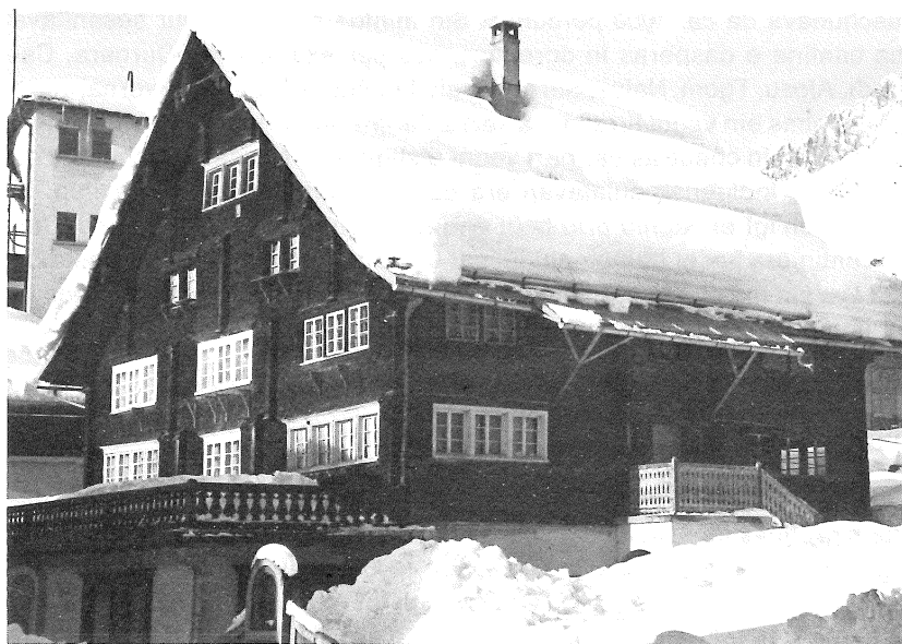
La veglia casa parvenda a Sedrun. Suten la stizun dil Consum liber

il plaun-teren cun aunc engrondir il sulom engiu ha ei dau in stupent local da stizun cun ina grondezia da ca. 120 m 2 , dasperas in biro ed autras localitads. La casa sco tala ei restada sco ella fuva. Il local da stizun ei puspei vegnius renovaus 1955. Damai che la casa suren fuva empau en decadenza eis ei vegniu concludiu 1968 da disfar ella totalmein e baghegiar ina nova tenor ils plans dils architects Robert Decurtins ed Albert Dettling. Il sulom ei puspei vegnius engrondius ensi, aschia ch'il local da stizun ha survegniu in volumen da ca. 200 m 2 , tut bein endrizzau alla moda moderna, cun ils necessaris magasins, maschinas e suren aunc 3 habitaziuns. Ils 19 da november 1969 fuva tut preparau ed ins ha saviu arver la stizun nova, nua che mintgin saveva ussa sesurviv sesez. Dalla casa sut via han ins saviu far bien diever duront il baghegiar. Suent eis ella vegnida vendida