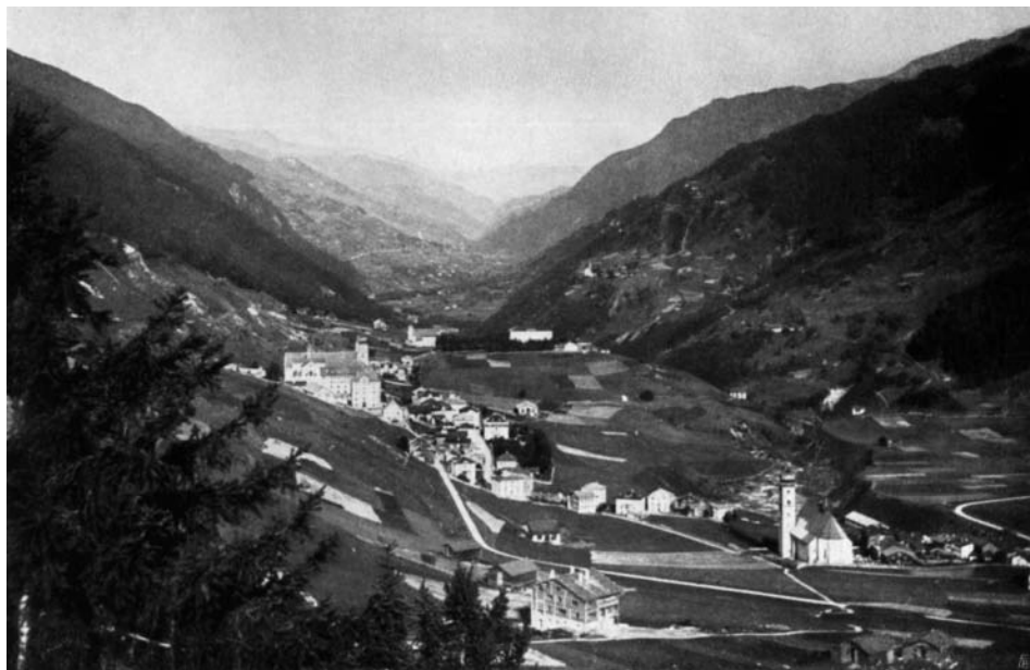
Mustér cun S. Gions e claustra