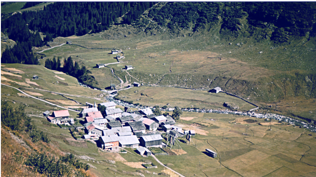
Selva avon 1949