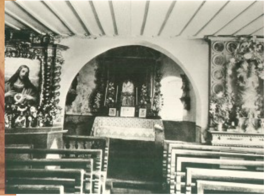
Caplutta da s.Clau avon la restauraziun da 1933