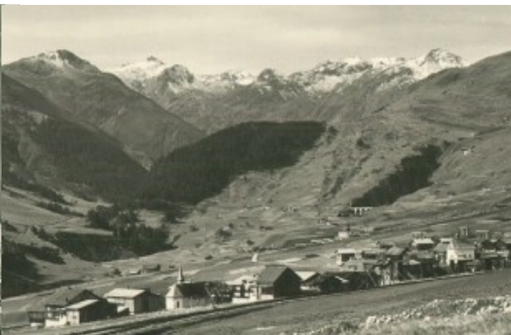
Camischolas e Zarcuns