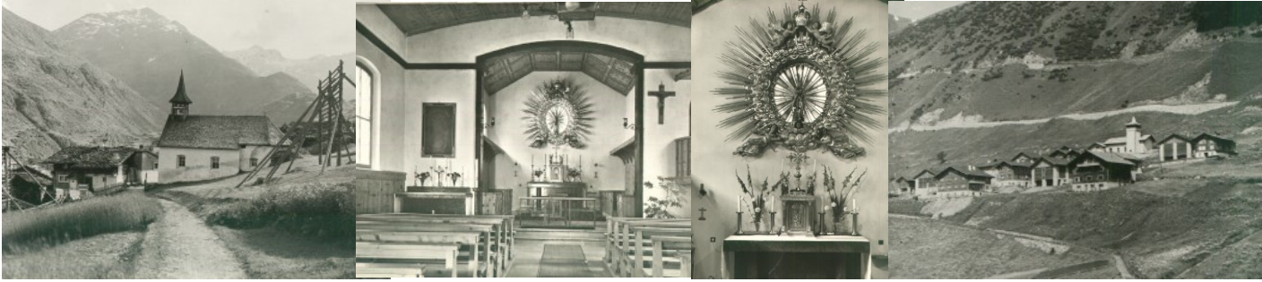
Selva avon 1949

Baselgia da s.Gion e s.Paul, oz baselgia dalla Nossadunna digl agid