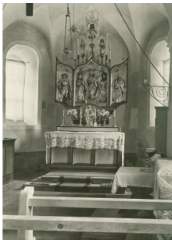
Intern dalla caplutta