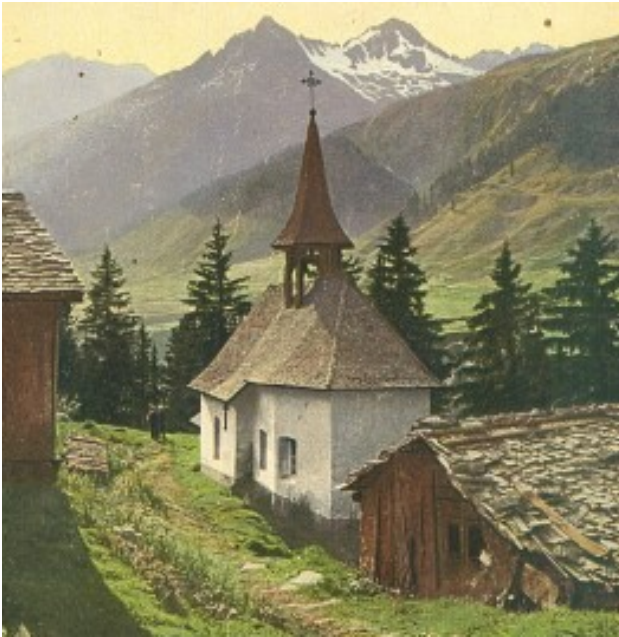
La caplutta d'avon 1927 si Foppas/Surrein