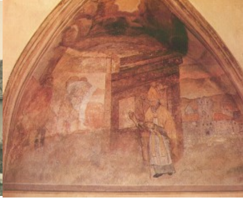
S. Clau spendra la veta als treis prencis condemnai