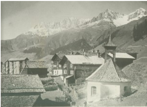
Bugnei cun la caplutta da s.Giusep