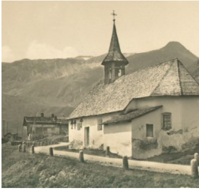
Tschamut cun la caplutta da s.Clau, entuorn 1920