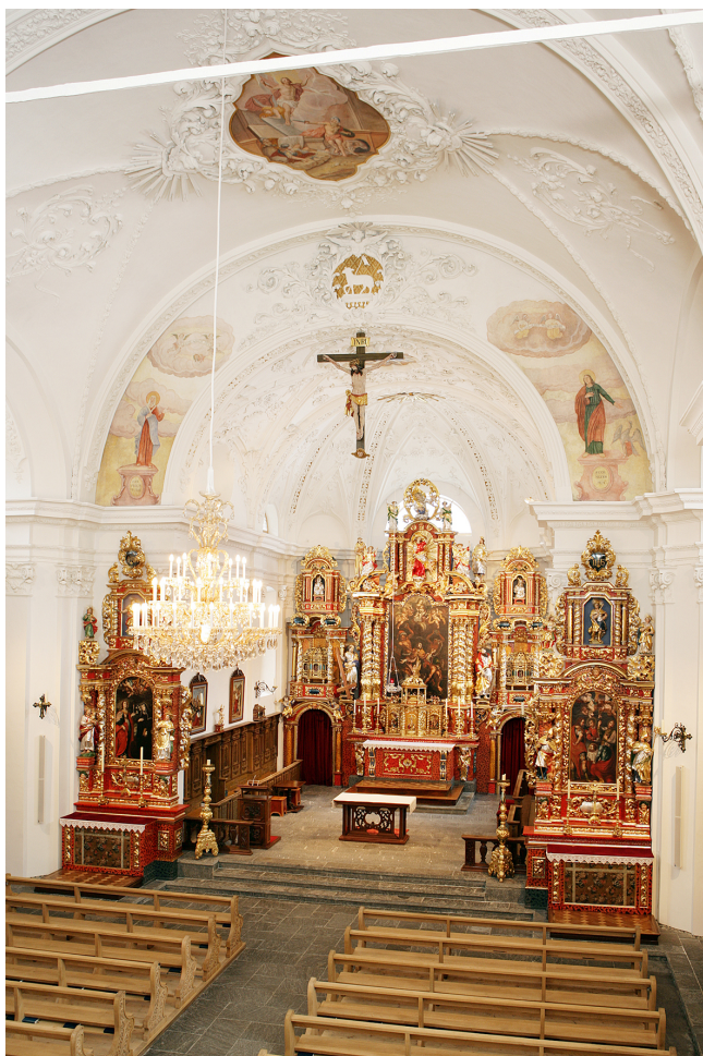
Suenter la restauraziun da 2005/06