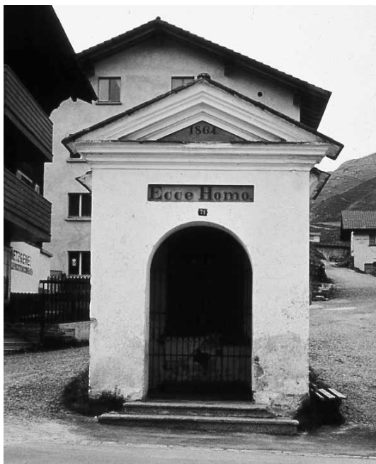
Sontget dils mats