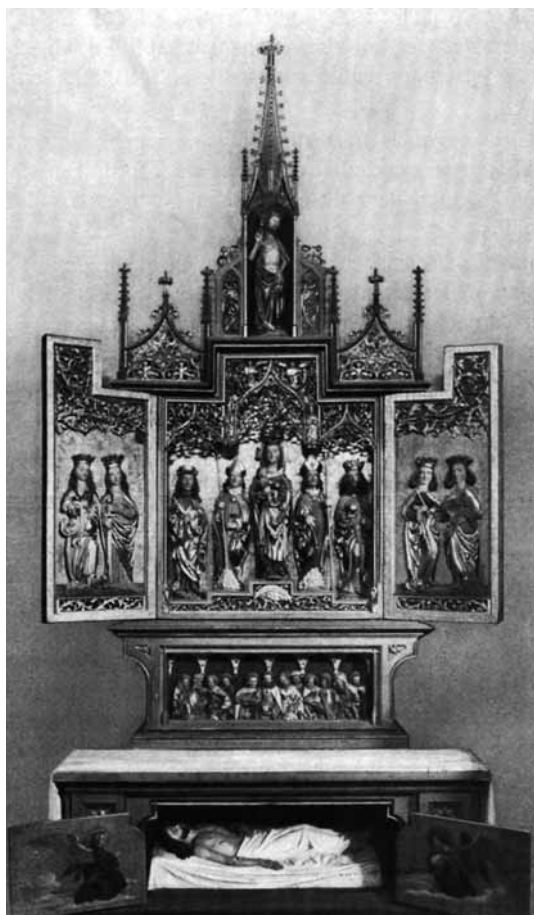
Altar dalla s. fossa