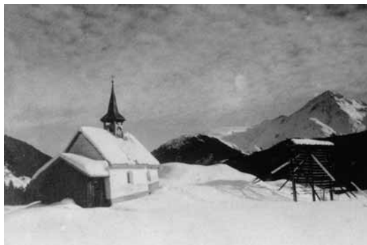
Cavorgia, s. Leci

sut peina dad in rensch. – La caplutta da s. Antoni sesanfla osum in precipezi, che ses-lucca adina pli e pli, e sa perquei vegnir cul temps en grond prighel.