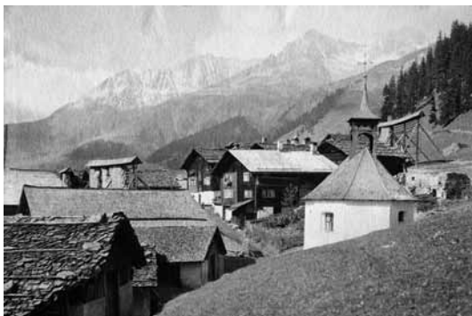
Bugnei, s. Giusep

Il zenn pign ei cullaus 1816, il grond 1843 dalla firma Theus a Favugn. – 1903 ei la caplutta vegnida restaurada, nua ch'igl arviul dad aissas ei vegnius remplazzaus cun in da gep.