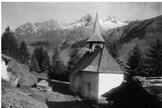
Surrein, anteriura caplutta si Foppas

Il zenn grond ei cullaus 1775, ferton ch'il zenn pign ha negin datum ed ei bia pli vegls. 1906 ei la caplutta vegnida renovada dadens e dadora ed ha aunc survegniu vitier in pierti cun aissas. 1917 ei la caplutta vegnida cuvretga cun plattas ord il Valleis.