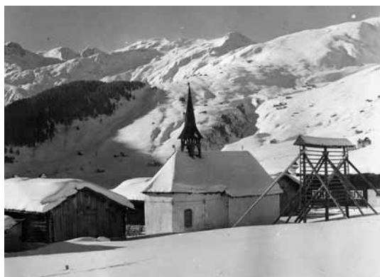
S. Onna a Camischolas

Suandontas veglias processions dalla pleiv da Tujetsch ein vegnidas fatgas per la davosa gada: la vigelgia da s. Gion Battesta a Segnas 1904, da s. Gieri a Mustér 1907, da s. Martin a Mustér 1907, da s. Pieder e s. Paul a Tschamut 1911. Persuenter vegn ei fatg ussa sin quels dis da Sedrun anora ina processiu a Zarcuns.