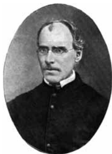
Beer Gion Bistgaun

a Rueras 1850–1853, fagend il medem temps era scola; plevon a Schlans 1853–1858; plevon a Ruschein 22 da november 1858, nua ch'el ei seretratgs alla fin da 1875, a motiv da fleivla sanadad; caplon a Laax 1877 avrel entochen october; caplon a Zignau 26 d'october 1877–1889. Ha resignau e privatisau silsuenther a Cuera el spital dalla Crusch, nua ch'el ei morts ils 24 da fenadur 1899 ella vegliadetgna da 79 onns ed ei satraus el santeri silla spunda sut il seminari da s.Leci.