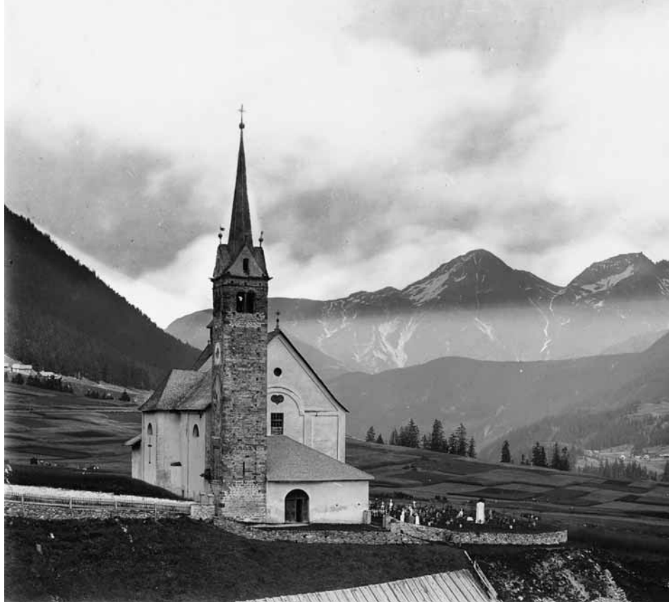
Baselgia parochiala da s. Vigeli

Sur la baselgia, ch'existeva avon quella dad ussa e la quala era vegnida baghegiada probablamein all'entschatta dil 13avel tschentaner, dat il rapport dalla visitaziun episcopala da 1643 in ualti clar maletg. Ella fuva situada pli enneu encunter il Drun ed era pli pintga che la presenta. Ella formava in quadrat el liung; il chor haveva arviul, ferton ch'il plantschiu-sura dalla nav fuva plats cun aissas, sustenius da duas retschas petgas. Sco altar grond el chor steva igl altar gothic, ussa altar lateral dalla s. fossa, cun las statuas da Nossadunna, da s. Leci e s. Flurin, da s. Vigeli e s. Bistgaun. Dil maun dallas femnas sesanflava in altar da s. Bistgaun cun figuras veglias, probabel en reliev bass, che representava Jesus, che vegn prius giud la crusch. Sper quei altar steva la porta dil clutger, che fuva quel dad ussa. Dil maun dils umens sesanflava igl altar da Nossadunna dil s. rusari cun siu maletg e quels da s. Dumeni e s. Catrina da Siena. Sper quei altar steva el mir da maun sut il battisteri. Ina bufatga gallaria da lenn circumdava aschibein igl altar, sco era il battisteri.