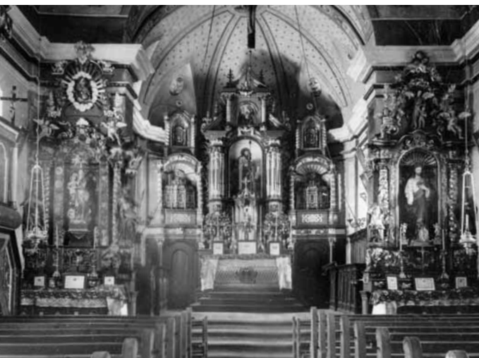
Intern dalla baselgia da s. Giachen

franzos, regalau la statua dil cor da Maria, fatga tenor la statua dalla archiconfraternitad a Paris, e ch'ei vegnida tschentada sigl altar dil maun dils umens.