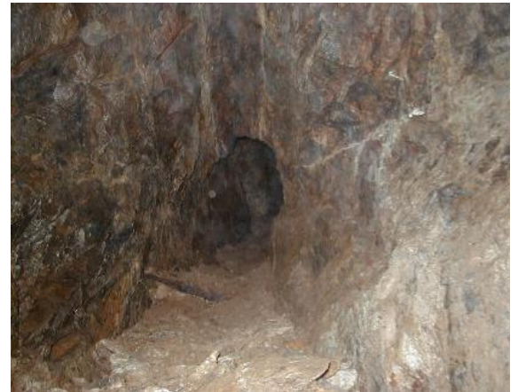
Impressiun digl intern!

La mina da Paliz ei stada plitost da pintga muntada per l'explotaziun da fier ella Cadi. Segir ha ella buca furniu gorndas quantitads da plum. Da lezs onns era il plum denton fetg tschercaus e pagava in bien prezi. Aschia han ils explotaders buca temiu las stentas e breigias. Era ei la dimensiun dalla ruosna pintga, cumparegliau cun autras minas en nies cantun. All'enschatta dil 18avel tschentaner ei l'explotaziun ida a fin e la ruosna en emblidonza. Oz dat ella a nus perdetga da temps vargai che nus carstgauns moderns vein pli e pli miseria da capir.