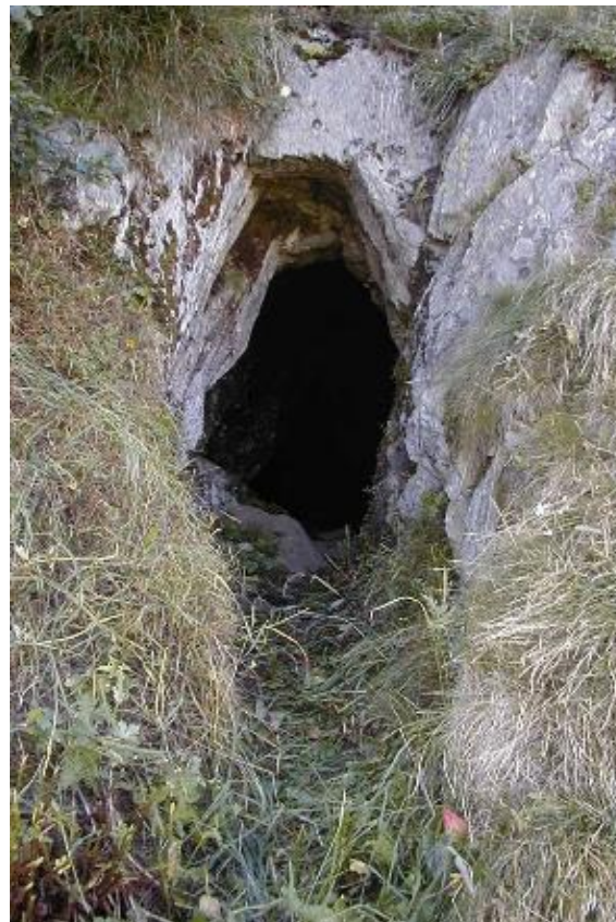
Entrada ella ruosna da Paliz

L'entrada ei pitgada ora en grep massiv, ed entuorn entuorn ves'ins aunc oz fetg bein las furadas cun puntgas da fier. Ina lavur admirabla, vegneva gie tut fatg a maun. Immediat suenter in per pass dat da seniester en egl l'annada 1697 ch'ei marclada ella greppaglia. Igl ir vinavon vegn ussa pli e pli grevs, ed ei dar nuot auter che semetter en schanuglias. La ruosna sesiara anetgamein e va ad ault. Mo da star en venter e seruschnar sc'ina talpa vegn ins ussa vinavon, e senza glisch fuss ei da far nuot. Mo anetgamein suenter quels diesch meters semida la