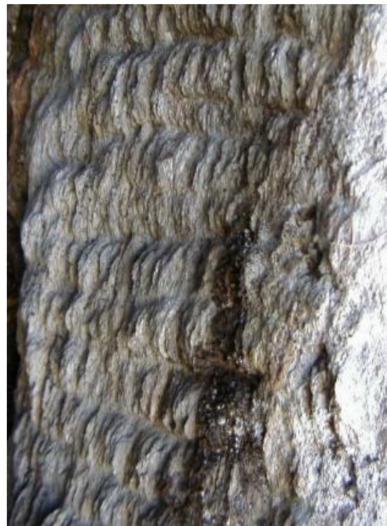
La fuorma dallas puntgas el grep alla entrada.