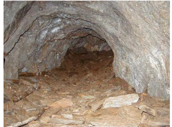
Ei vegn pli stretg.