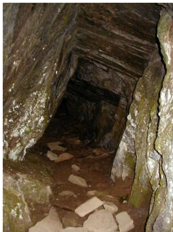
Is emprens meters viaden el cuolm.