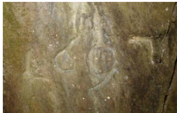
L'annada 1697 marclada seniester el grep massiv.