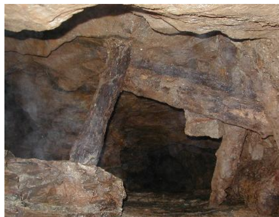
Pals che sprunan e tegnan la greppa a mistregn.

Gest dalla Ruosna da Paliz agradgiu, alla riva dil Rein da Nalps secatta in liug che vegn numnaus ils Falluns. Pli probabel vegneva il mineral da fier menaus dalla mina sin targliuns dallas teissas spundas da Paliz giuado tochen als falluns. Leu vegneva il crap luvraus e tractaus vinavon. Il falluns manizzavan cun agid dalla forza d'aua il crap che cunteneva il custeivel metal. Plinavon vegneva il prezius crap lavaus e sortius – ina lavur che vegneva era fatga da femnas ed affons. Magari entiras familias che luvravan vid l'exlotaziun da fier, il bab secapescha sco minier ella stolla. Schebein il fier vegneva era culaus en quei liug, gliez ei grev da dir. Ils plazs da cular vegnevan adina puspei disloccai en auters loghens, pertgei quella lavur duvrava grondas quantitads da lenna. En scadin cass fuva il crap manizzau e lavau pli sempels da transportar vinavon e forsa cular en in auter liug. In mussament dalla lavuraziun dil mineral da fier ei da cattar allas rivas dil Rein dalla Val Gierm. Gest sper la tschaffada d'aua entras