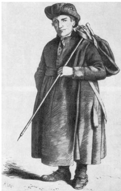
Pader Placidus a Spescha, sco alpinist e cavacrappa, 1752 - 1833.