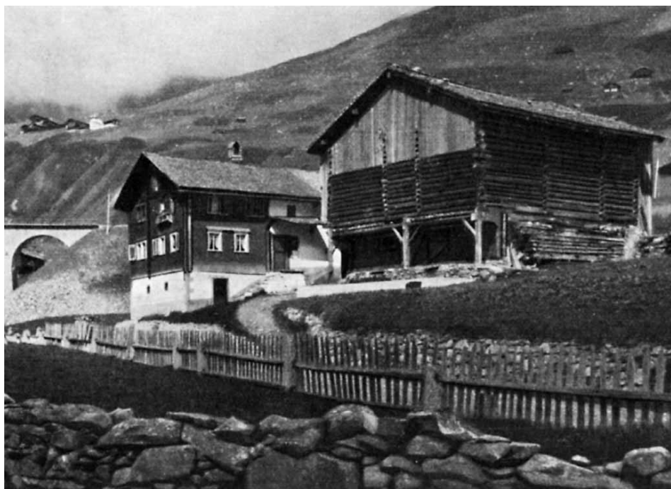
Dieni, casa paterna

Pader Baseli ei suenten liunga malsogna morts la vigelgia da Nadal 1931. La sepultura ha giu liug ils 28 da december, nua che varga 60 persunas da Tujetsch e da quei da 30 spirituals ein stai presents. Bein in mussament da respect e renconuschientscha per la lavur da pader Baseli Berther en favur dil pievel dalla Cadi e la Romontschia.