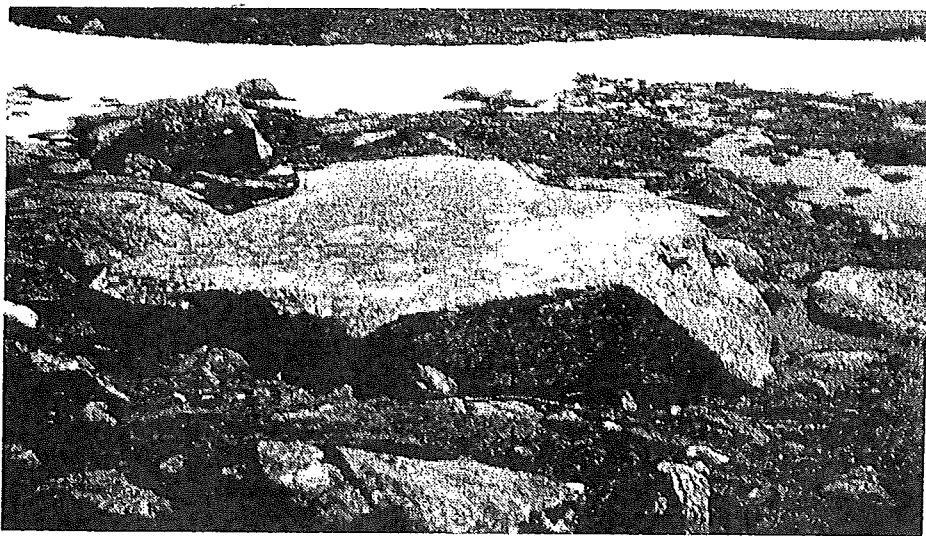
La platta dil barlot si Caschlè

La detga dalla platta dil barlot ei ina dallas pli enconuschentas detgas ch'ei dat en Tujetsch e tgunsch era ella Surselva. Igl ei ina remarcabla detga, perquei ch'ella ha surviviu biaras autras detgas ed jeu sundel perschuadida ch'ella vegn aunc a far pial gaglia a biars affons.