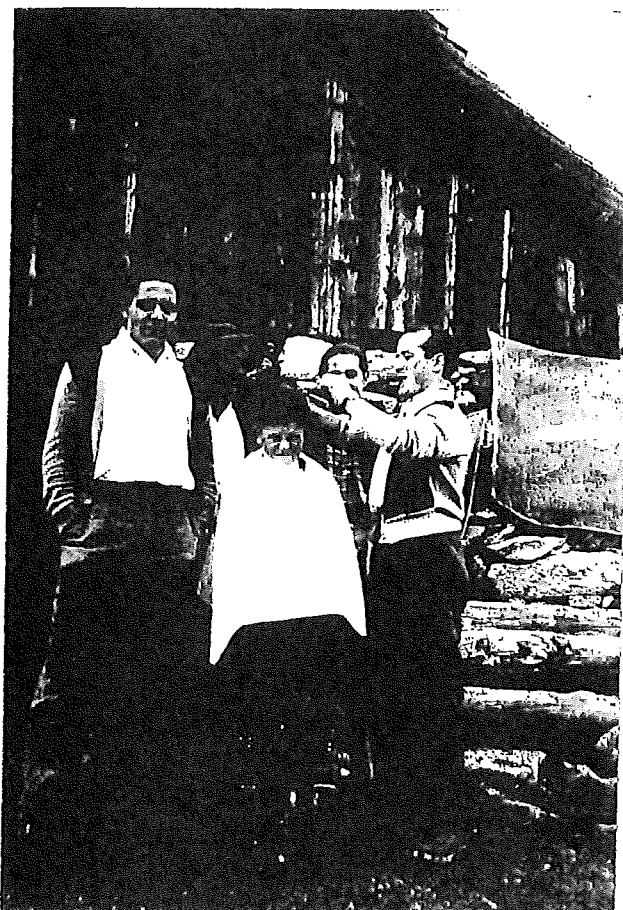
Vigeli sco purtger si cuolm Val, Tegia Gronda entuorn 1953

gia per visitar siu frar pign. Suenter quella viseta ein ils examens gartegiai bia meglier e senza pli grondas stentas. Mintgaton drova ei semplamein in pign-sustegn moral per che las caussas gartegien meglier e mondien pli lev. Turnaus suenter ils examens reussiu a casa, ha il Vigeli luvrau persuls ensemen cun siu bab en scrinaria entochen igl onn 1968. Dasperas gidava el a far il pur e segidava a casa cun ses fargliuns pli giuvens.