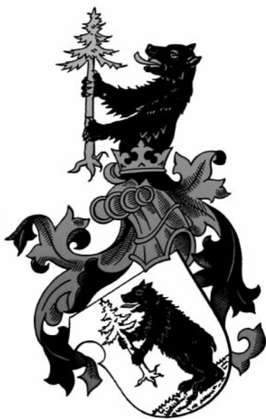
Uoppen dils Berther's

L'arma (igl uoppen) dils Berthers representa in uors insè, brancond in pegn solitari. Igl uors ei il simbol dalla forza e robustadad – ed ei perquei aunc oz significativs per l'entira descendenza bertheriana! Igl uors ei gia svanius dapi tschien onns en Tujetsch, mo quels dall'arma uorsica vivan e semultiplischeschan aunc oz, sco da sias uras ils tschuts da Jacob ella bibla. Ils Berthers ein numnadamein, da