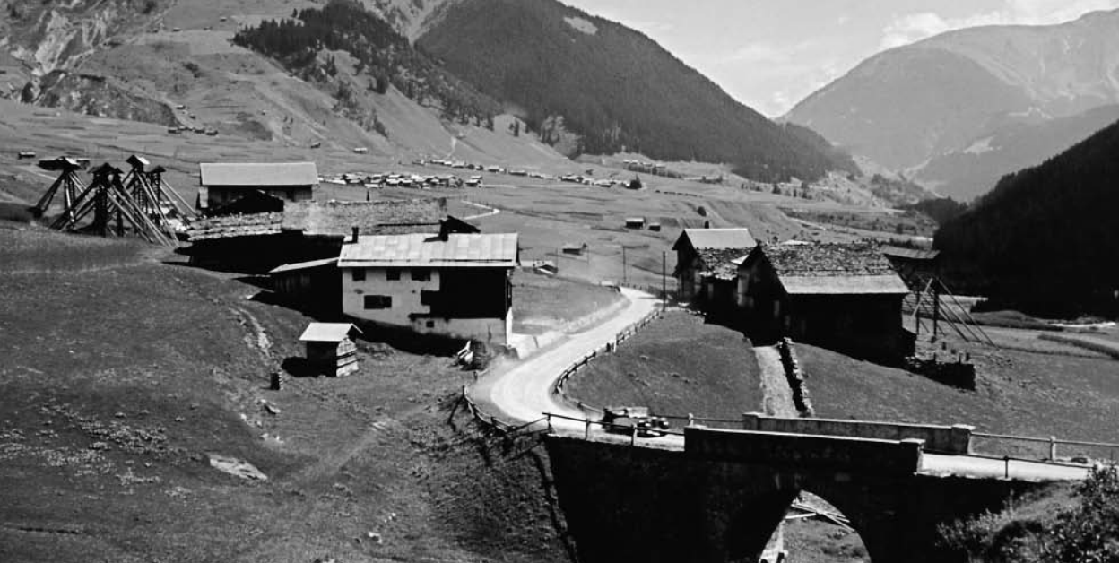
Casa paterna a Dieni

sur ina bellezia pastira, il gigantic Uaul Surrein stgir-verds sco las buolas da S. Brida. Tgei rasada uaul per liung e per lad ed en altezia, e sur el s'extenda l'Alp Tgom cuagl Uaul Davos Nacla e Val Nalps. Tgei deletg pigl egl e pil cor!