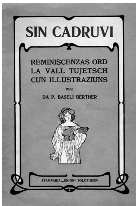
Cudischet «Sin Cadruvi»

opus seigi dil tut ses; a mi par'ei, che quella cumedietta seigi mo adattada e per part schizun translata mo memi exact. – Ultra da quella ha pader Baseli aunc translatau pliras cumedias, che existan aunc en manuscret ella Biblioteca romontscha dalla claustra e ch'ein vegnidas dadas bien a savens!