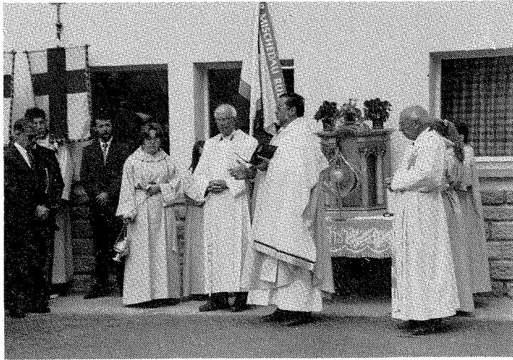
Fiasta dall'inauguraziun dalla baselgia s. Giachen a Rueras