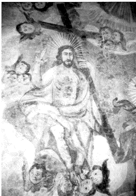
La levada da Cristus (arviul caplutta s. Onna)