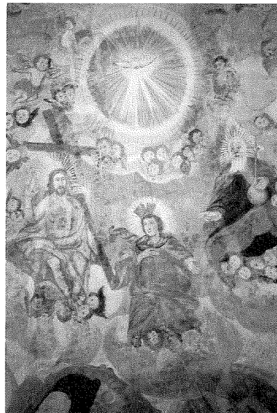
Assumziun da Maria (arviul caplutta s. Onna)

Cun plascher notifichein nus egl onn da gestiun che 8 pignets ein vegni pri si ella cumminonza dalla pleiv entras il baten. Sch'ins mira anavos mo paucs onns sche constatein nus ch'il diember dallas naschientschas ei sesminuius considerablamein ils davos onns. Tonpli admettein nus a geniturs ed affons nossa cordiala gratulaziun e nos megliers auguris pil futur.