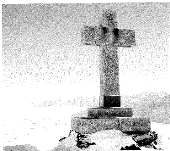
Crusch da granit sil Calmut

Il Segner ha priu - Il zenn grond ha annunziiau uonn 17 ga la mort d'in vischin da nossa pleiv. Els ein suandai la steila da Nadal che ha menau els vi ella perpetnadad. Ils ins han fatg quei ella fluriziun dalla veta, ils auters cun empau dapli onns. Dieus dispona sur da tut. Denton ussa astgan els guder buca mo la splendor dalla steila mobein la splendor da Cristus. Per tuts survetschs fatgs a nossa cuminonza engraziein nus e schein Dieus paghi. Bugen lein nus mantener Vus cars defuncts en buna memoria.