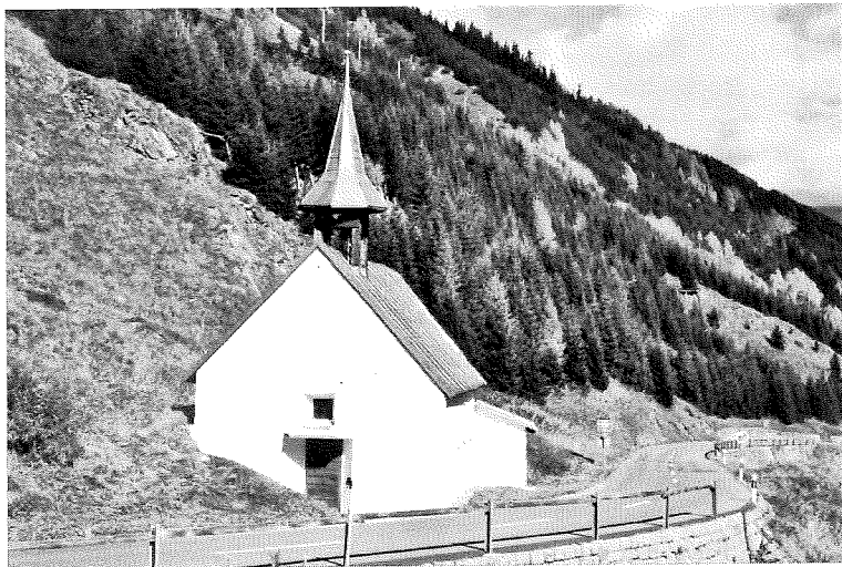
Caplutta s. Clau a Tschamut