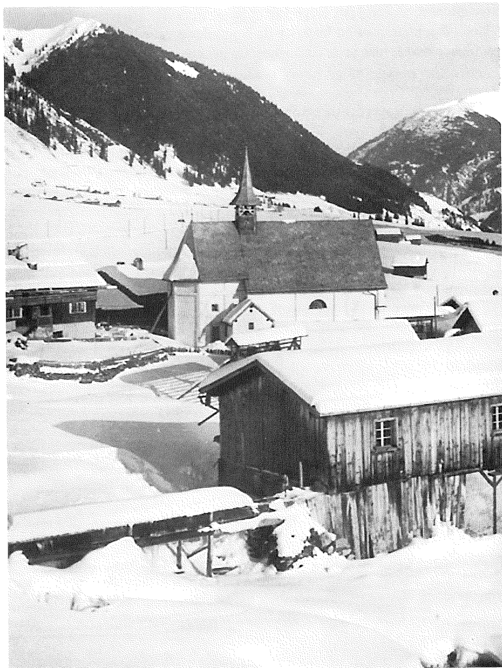
Rueras cun la baselgia entuorn ca. 1925.