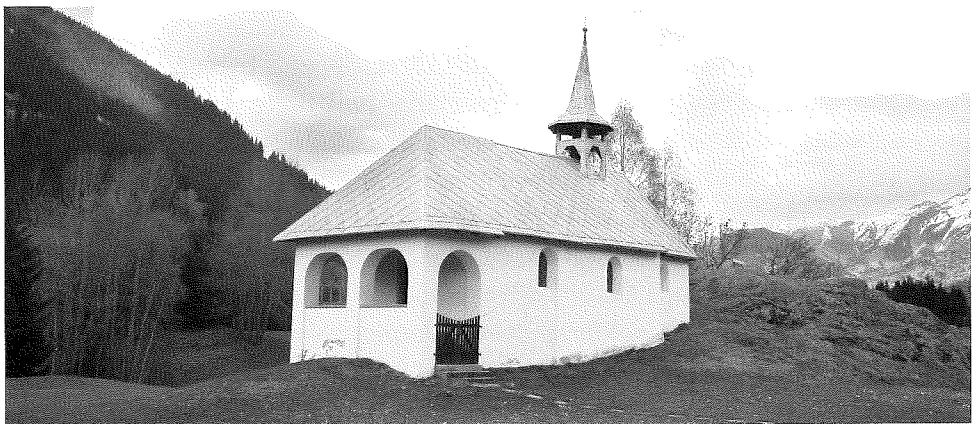
Caplutta a Cavorgia

Cun igl onn da scola 2012/13 entscheiva lu l'instrucziun tenor il model decidu dil pievel grischun 1+1. Vul dir in'ura ductrina ed in'ura etica. Quella midada entscheiva gl'empren onn per classa 1 dal scalem superiuor, 2013/14 cun la secunda classa e 2014/15 lu aunc cun la tierza classa superiura.