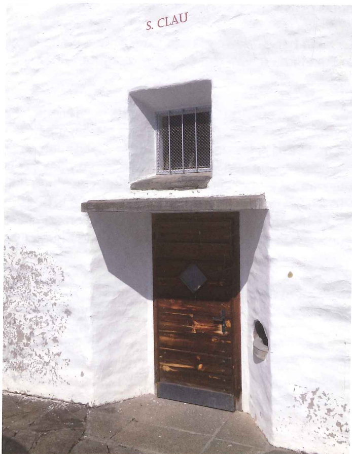
Caplutta s. Clau a Tschamut