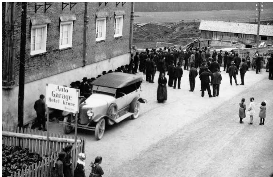
Il plaz Cadruvi