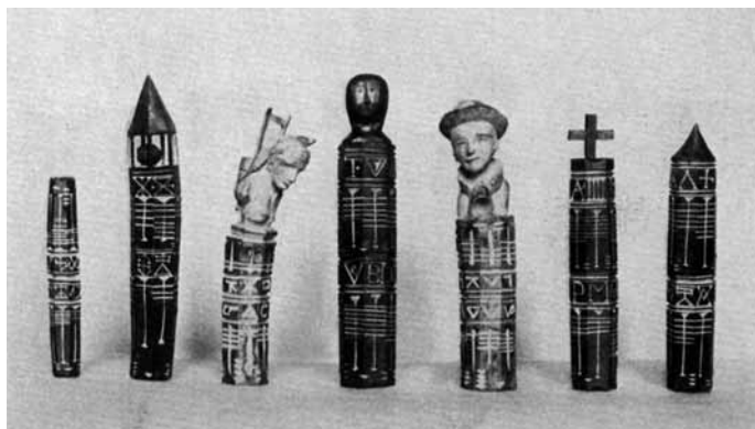
Stialas da latg

exempel silla stiala cun crusch, tier la noda A. 72\frac{1}{2} crenas latg = 7 cruschs + 2\frac{1}{2} crenas; noda P. 46 crenas = 4\frac{1}{2} crusch + 1 crena. Ils quarts vegnan buca quintai.