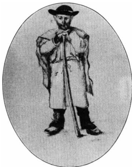
Il starler grond

Cadruvi cul cautegia. Plirs purs havevan cattau adagur el ed eran vegni neutier per dumandar tgei lur genetschas fetschien. «Tge fo la mia? Tge fon las mias?» Il starler ludava. «Ils tiers stattan bégn, on fatg ina stroda prova, i en plein tgarn. La tia è ina dallas meglieras. Tia blaua è serefatga, té gnanc enconuschesses plé ella. Dentaun, i è nueta taun dareit maglia, las munglassen béta pegera, ju stess mal. I fuss bien, sch'ins savess gleiti turnar anno cun ellas.» – Quei era sia parola, schegie ch'ei era aunc maglia pli che avunda. Denton ils purs enconuschevan beinavunda lur vegl starler e schavan tulanar el vinavon. Il starler haveva era saviu purtar la nova, ch'ei seigi stau si avon paucs dis tut discusamein marcadonts, che hagian mirau las genetschas. Quei era emperneivla aura pils purs e beinenqualin studiava gia suenter, cons marenghins la sia pudessi valer. «On i era mirau la mia?» damonda quel e tschel il starler. «Ge, ge, ju a è stiu mussar ella; i on è nudau se la tia!» Aschia consolav'el ils purs, il bien starler, ch'era pigl auter in um versau en fatgs dad alp.