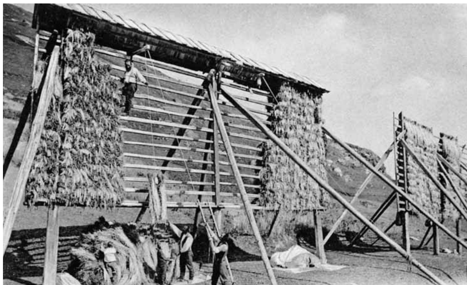
La lavur da caschinar

nas han survegniu ina cumpleta idea, co ins stoppi ir suenter las uolps. «He, gl'auter; quella da tschai dé o quella dal fil gidau a fa giu ad o rut giu la cua. Savai son las femnas taun scû nuét. Dantaun ju a cusiu cun in fil, tg'ini encorgia nuét plé. Per vender fuss quai schagliuc aunc donn.»