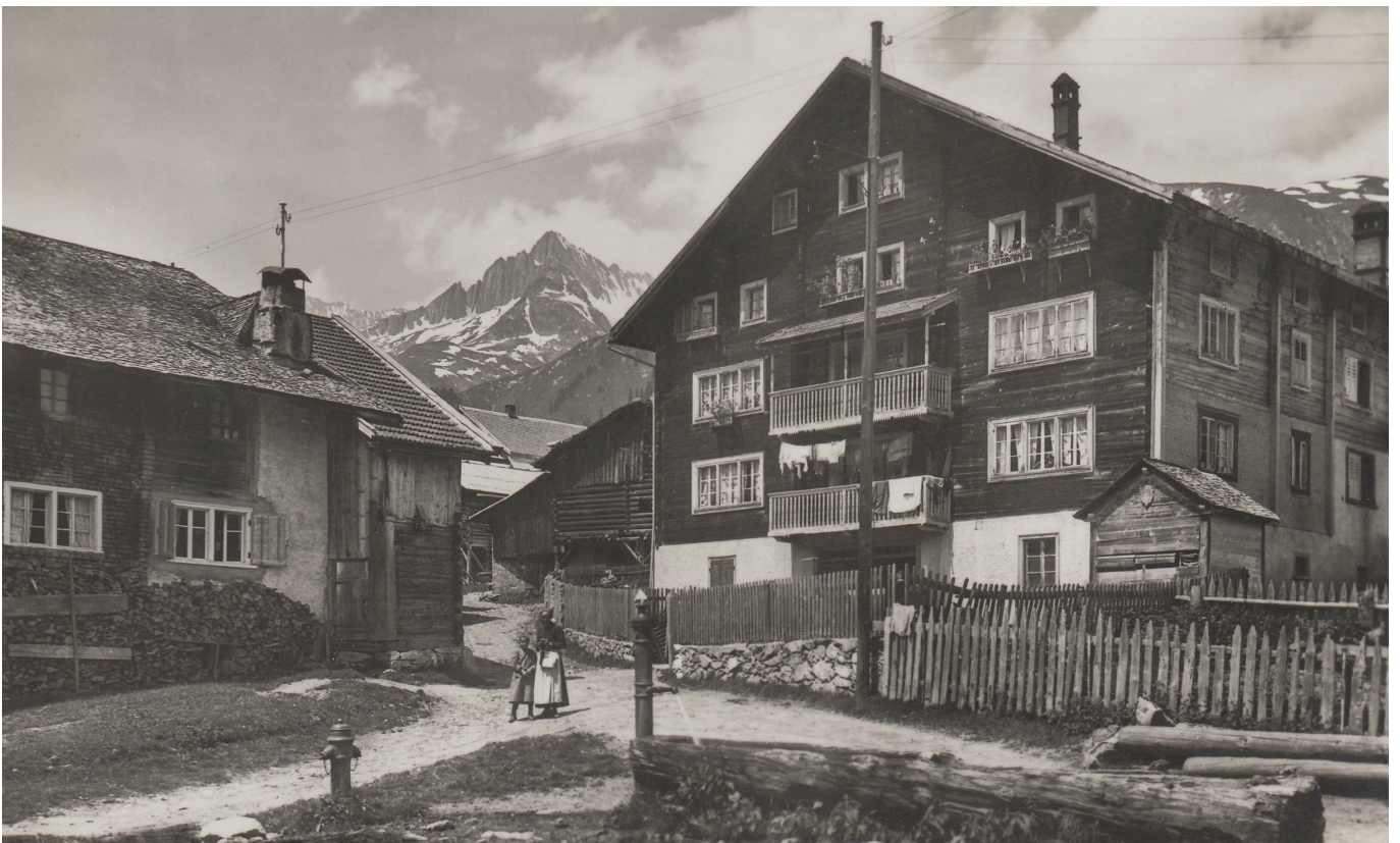
Idilla spel begl odem il vitg da Sedrun

NB. La vischnaunca da Tujetsch ha aunc entgins particulars regulativs, ariguard il far fein a pastg, ariguard ils dretgs da schar pascular nuorsas, pors e cavals la primavera etc., ils quals ein buca pri si en las leschas antecedentas, secartend ch'ei fetschi buca da basegns.