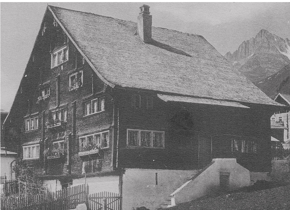
Veglia casa pervenda a Sedrun

IV. Naven dils cunfins dadora dalla sura numnada schetga nova, l'entira Val Giern entochen tier ils cunfins dalla vischnaunca da Medel , ei era uaul cumin.