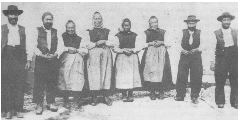
Ils fargliuns Schnoz da Tschamut