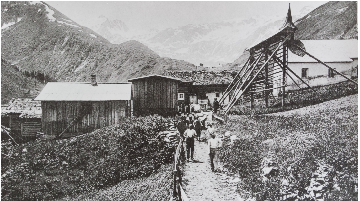
Via veglia a Selva cun la caplutta da s. Gion e s. Valentin