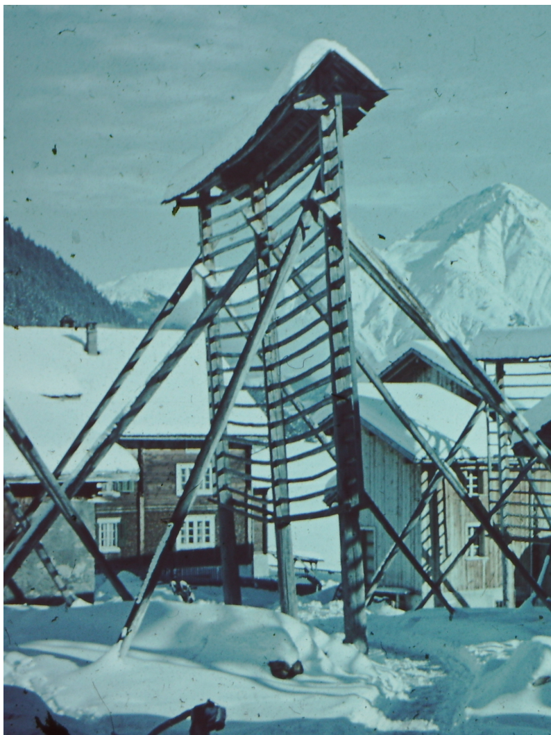
Impressiunont chischner amiez il vitg da Sedrun , oz Via dil Bogn .

E tgi che cunterfagess ad in ni l'auter da quels puncts, duei esser curdaus en castitg dil ludeivel obercheit.