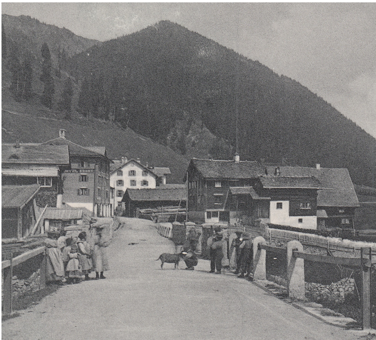
Punt denter Sedrun e Gonda , eregida culla construcziun dalla via ils onns denter 1862 e 1864